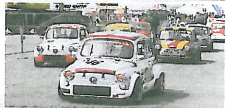
Die Zwerge gehören für viele Fans zu den Grössten.

Obwohl es nicht um Rundenbestzeiten ging, war die «Race History on Track» mit vielen teils seltenen Rennwagen ein Leckerbissen, ebenso der «Kampf der Zwerge». Die «frisierten» Tourenwagen (heute sagt man getunt) vom Schlage der Fiat Abarth, NSU TT, Mini Cooper und Steyr-Puch eroberten die Herzen der Zuschauer. Sie waren genauso attraktiv wie die Rennwagen – und obendrein vielfach besser pilotiert. Auch Jim Clark hätte wohl seine Freude daran gehabt.