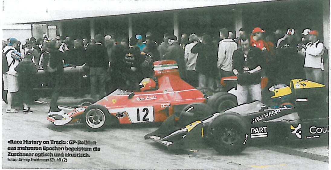
«Race History on Track»: GP-Boliden aus mehreren Epochen begeistern die Zuschauer optisch und akustisch.