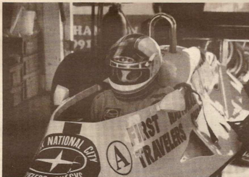
Über die Wintermonate wird der Wagen total überholt