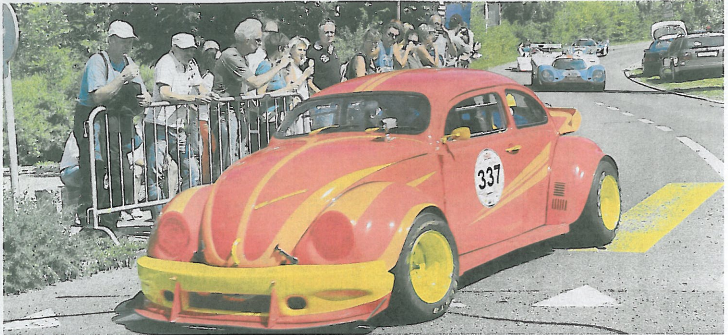
Ein Porsche 3 Liter Boxer mit 250 PS lässt diesen Käfer beinahe fliegen.