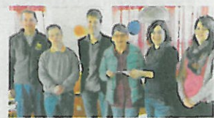
Vertreter der Musikgesellschaft übergeben den Check.