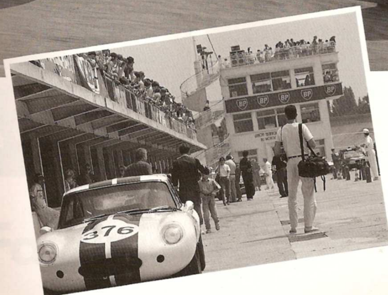
Boxenstimmung wie 1963... als die eingesetzten Wagen noch neu waren.