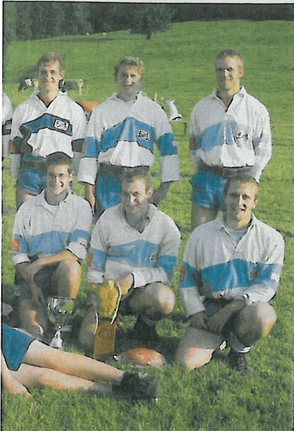
30 kg des Seilziehclubs Ebersecken.